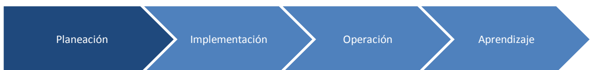
Figura 3- Planeación.

Este paso le permite a su entidad definir el alcance que desea darle al ejercicio de democracia participativa por medios electrónicos, el cual se encuentra definido en el proceso: planear la participación por medios electrónicos del modelo para incentivar la participación y la democracia. Para apoyar este proceso se puede utilizar la ficha para definir el plan de participación por medio electrónicos.