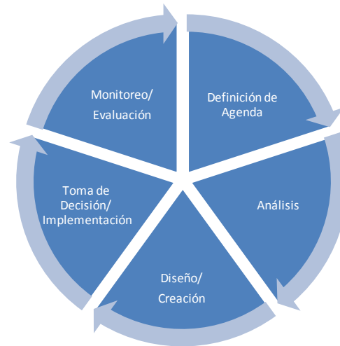
Figura 4- Ciclo de vida toma de decisión 2

A continuación se presentan ejemplos para cada una de las etapas en este ciclo.